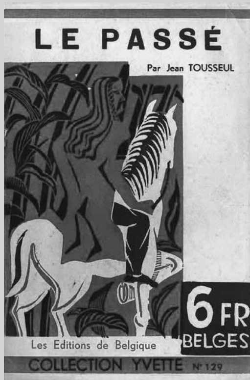
Jean Tousseul, Le Passé , Les Éditions de Belgique, Bruxelles, 1933. 12×18,5 cm. Collection Yvette nr 129. [Biblioteca Andana, col. Yves Soree]