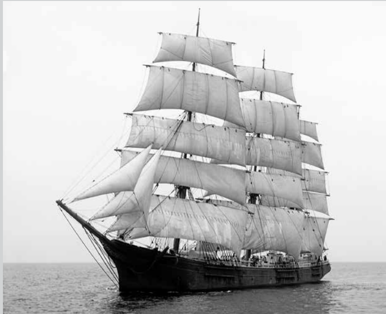
Driemaster zoals weergegeven op de omslag van de Éditions de Belgique. [Trois-mâts carré Mary L. Cushing, entre 1883 et 1895. Négatif sur verre, 25×20 cm.]