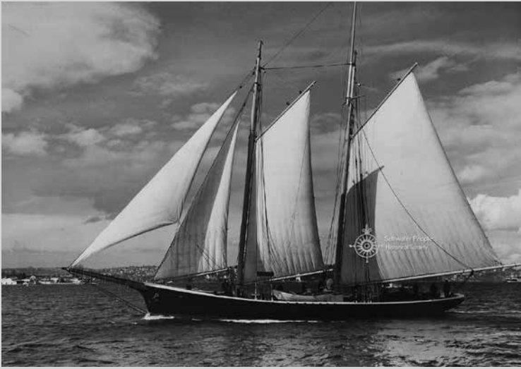
Hiernaast een schooner zoals beschreven in het verhaal van Jean Ray. [Schooner Gracie S]