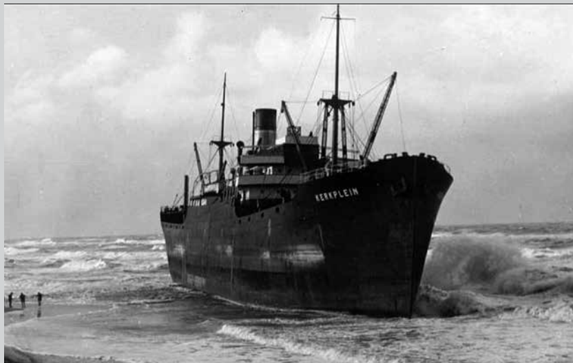
Stoomschip zoals afgebeeld op de omslag van de Editions Alma. [Stoomschip Kerkplein op het strand bij IJmuiden, Nederland 1935. ]