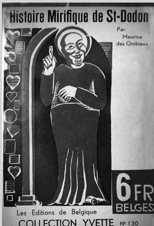
Maurice des Ombiaux, Histoire mirifique de St-Dodon , Les Éditions de Belgique, Bruxelles, 1933. 12×18,5 cm. Collection Yvette 132.